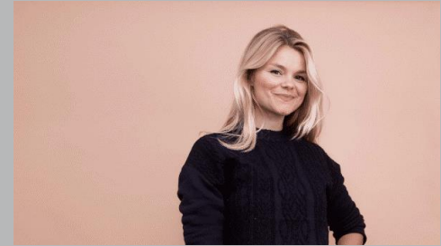
Female Leadership Academy