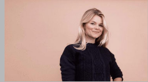
Female Leadership Academy